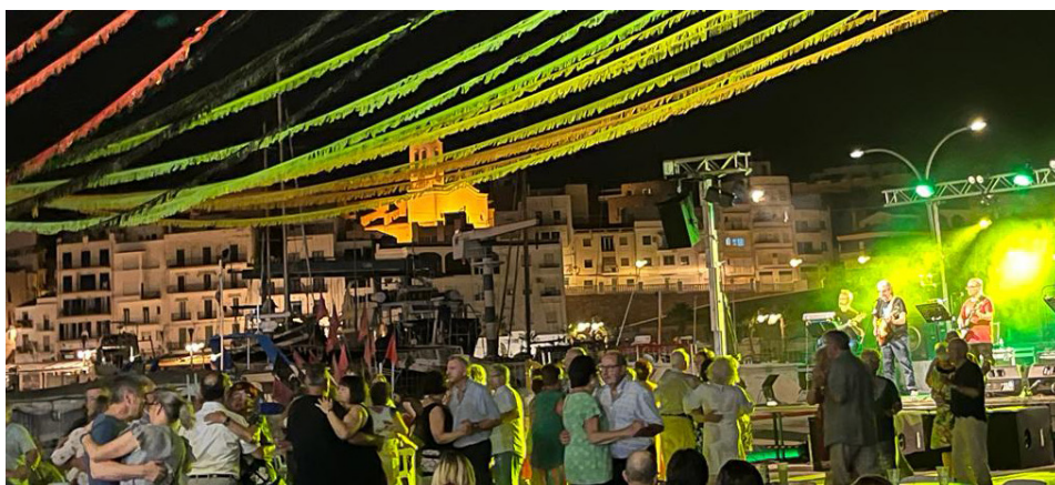
Festes de Sant Pere a L'Ametlla de Mar

L'Ametlla de Mar es prepara per viure, del 26 al 29 de juny, unes Festes de Sant Pere marcades per tradicions emblemàtiques, revetlles populars, degustacions gastronòmiques i actes religiosos en honor al patró dels pescadors. La nova Confraria es convertirà en l'epicentre d'una celebració que manté viu l'esperit mariner del municipi.