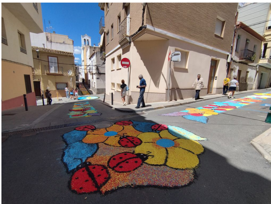
Catifes de la cruïlla entre el carrer Bruc i el carrer Prim

L'Ametlla de Mar tornarà a viure aquest diumenge 7 de juny una de les seves tradicions més emblemàtiques amb la celebració de les Catifes de Corpus, una manifestació de cultura popular que des de 1986 transforma els carrers del nucli urbà en un mosaic efímer de colors i formes.