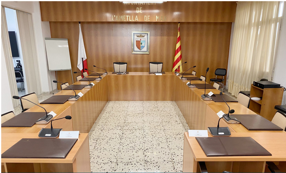
Sala de plens de l'Ajuntament de l'Ametlla de Mar

L'Ajuntament de l'Ametlla de Mar viurà aquest divendres 17 d'abril a les 12 h una de les sessions plenàries més transcendents dels darrers anys. El ple extraordinari convocat per debatre la moció de censura presentada per ERC, PSC i Entesa per la Cala culminarà, si es compleixen les previsions, amb un canvi de govern municipal i amb el retorn del republicà Jordi Gaseni a l'alcaldia durant els darrers catorze mesos de legislatura.